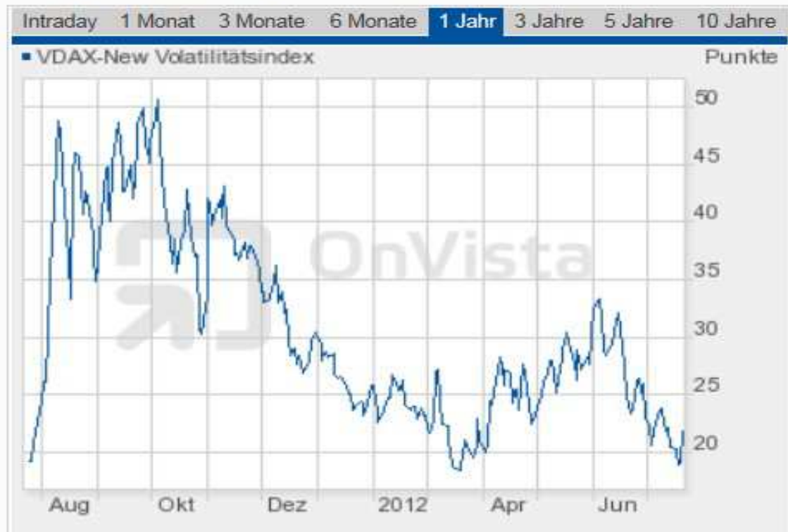
Chart VDAX-NEW VOLATILITÄTSINDEX

Con VDAX-NEW < 20, zonas de 30 puntos para posiciones largas y 35 puntos para posiciones cortas.